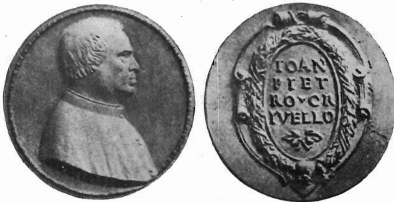
FIG. 11 - TORINO, RACCOLTE NUMISMATICHE REALI - GIAN PIERO CRIVELLI: Medaglia con autoritratto.