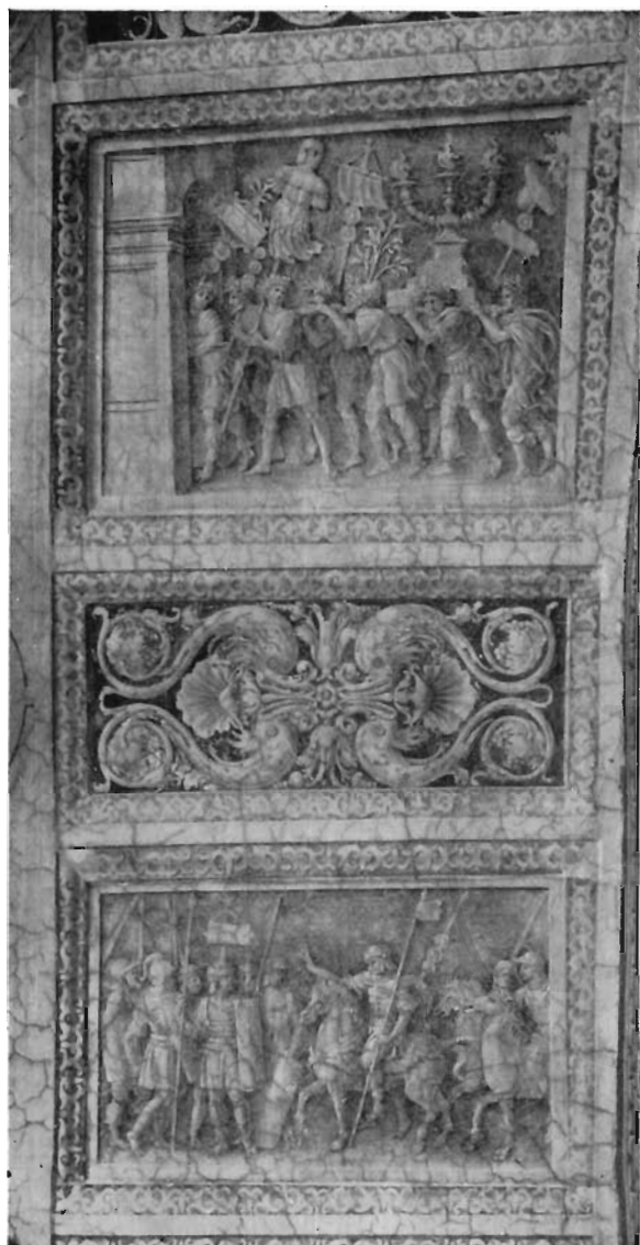
FIG. 1 - ROMA, STANZE DI RAFFAELLO - JACOPO RIPANDA: Decorazione di sottarco nella Stanza dell'Eliodoro.

intricato combattimento fra un cavaliere e vari fanti, derivano dai rilievi della colonna Traiana.