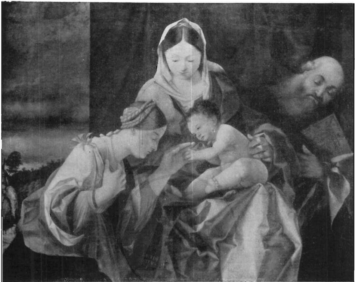
FIG. 9 - MONACO, PINACOTECA - LORENZO LOTTO: Sposalizio mistico di Santa Caterina.

(fig. 10). La presentazione del personaggio su di uno fondo aperto di paese è unica nella ritrattistica del Lotto, e basta ad accertare che l'opera fu dipinta sotto l'influenza di esemplari tosco-romani. Dal Berenson questo ritratto fu posto in relazione con quello bergamasco dei Della Torre (Londra, Galleria Nazionale), ch'è del 1515, ma la posizione frontale e una certa rigidità di atteggiamento gli danno un'impronta più arcaizzante. Qui ci soccorre, per assicurarci della data, l'identificazione del personaggio: questo grosso borghese che offre all'ammirazione dei clienti la sua preziosa mercanzia è l'orafo milanese Gian Pietro Crivelli, che nel settembre del 1509 si era fatto mallevadore del Lotto per i lavori da farsi in Vaticano (cfr. nota 14).