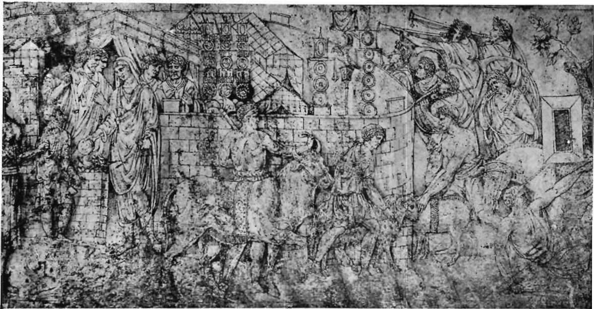
FIG. 5 - ROMA, BIBLIOTECA DELL'ISTITUTO NAZIONALE D'ARCHEOLOGIA E STORIA DELL'ARTE - JACOPO RIPANDA: Disegno dalla Colonna Traiana.

A un concetto decorativo di semplice ripartizione degli spazi se n'è sostituito uno di illusionismo prospettico, e ciò basterebbe ad indicare, anche se non lo rivelassero gli altri