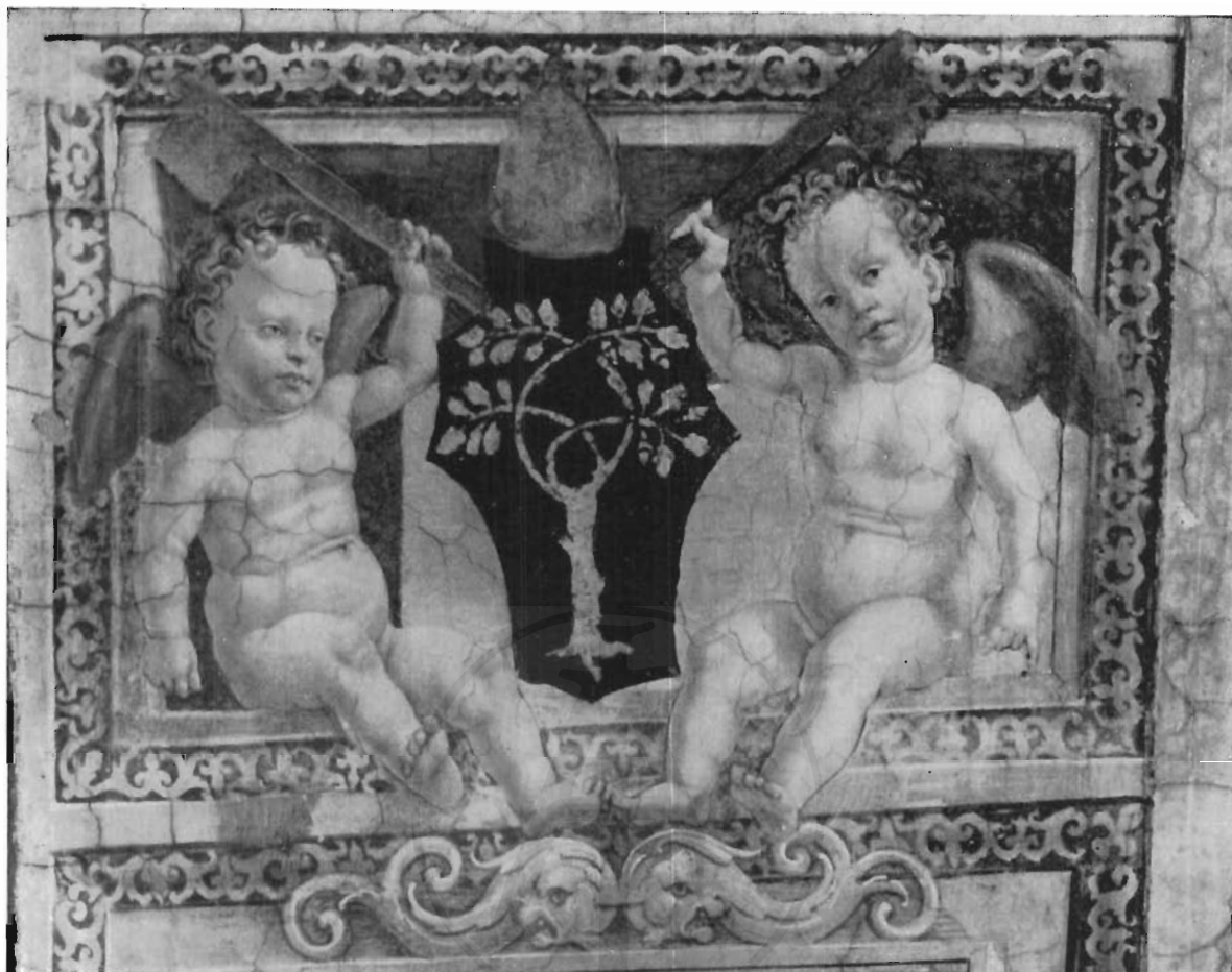
FIG. 8 - ROMA, STANZE DI RAFFAELLO - LORENZO LOTTO: Decorazione di sottarco nella Stanza dell'Elidoro (Fot. Gall. Musei Vaticani).

« in cameris superioribus pp. prope librariam superiorem ». Secondo l'ipotesi, non concordemente accettata, del Wickhoff 13) , la nuova libreria privata del Pontefice doveva identificarsi con la Stanza poi destinata alla « signatura Justitiae » e alla « signatura Gratiae », nella quale non solo tutto il concetto informativo della decorazione è inteso a glorificare le arti e le scienze, ma anche gli affreschi minori hanno per protagonisti dei libri: quelli a chiaroscuro al disotto del Parnaso, e quelli al disotto delle Virtù, che ripetono il soggetto dedicatorio dipinto da Melozzo per la Libreria di Sisto IV. La nota di pagamento del Lotto, dalla quale risulta che la Libreria Nuova doveva trovarsi al piano stesso delle Stanze che Giulio II faceva allora restaurare, avvalorava l'ipotesi del Wickhoff, e da essa viene chiarita: il Lotto doveva dipingere in una stanza presso quella poi destinata alla Segnatura, e poiché in quella dell'Incendio lavorava il vecchio Perugino, possiamo trovare nel documento la conferma che gli fu affidata la decorazione della Stanza di Elidoro.