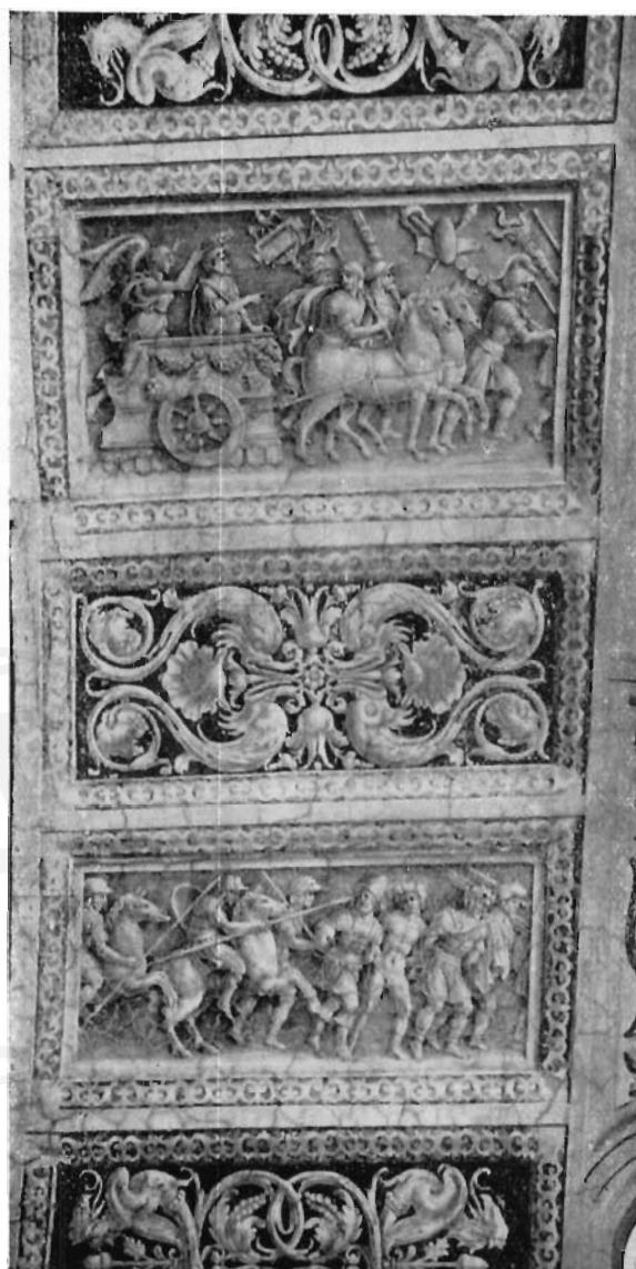
FIG. 2 - ROMA, STANZE DI RAFFAELLO - JACOPO RIPANDA: Decorazione di sottarco nella stanza dell'Eliodoro.

Molto più gradevoli degli affreschi capitolini sono questi piccoli monocromi; in questa decorazione minuta e meno impegnativa non c'è la presunzione dei grandi affreschi, ed ogni scenetta, limitata ad un solo episodio, è composta con molto maggiore chiarezza.