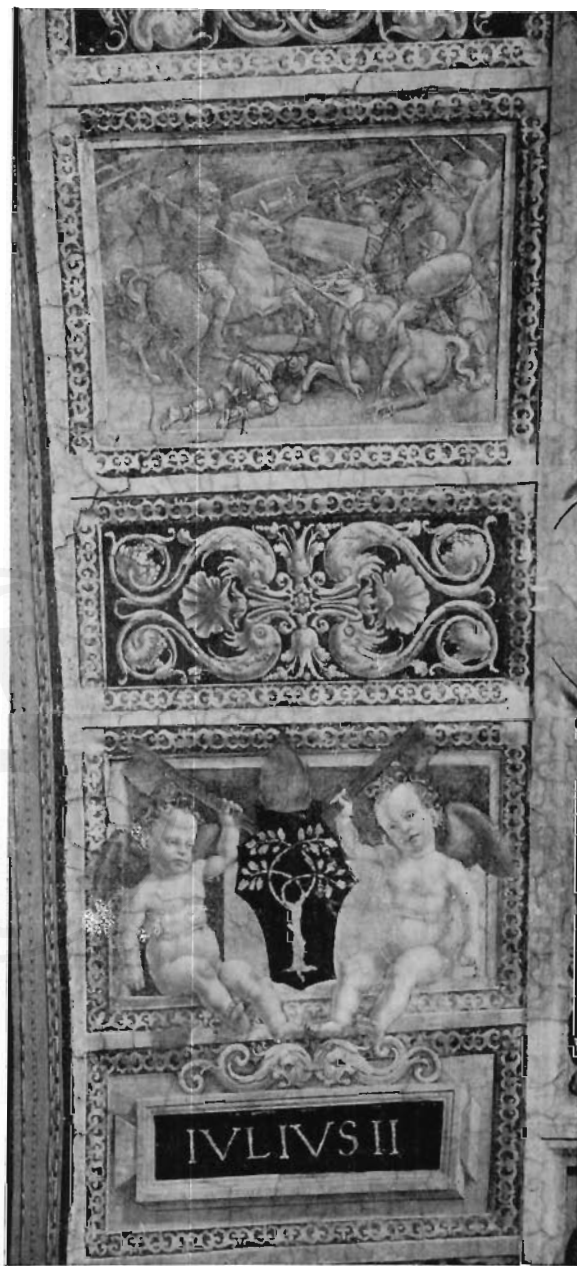
FIG. 7 - ROMA, STANZE DI RAFFAELLO - Decorazione di sottarco nella Stanza dell'Elidoro.

La ricevuta del Lotto dà indicazioni precise del luogo dove egli doveva dipingere: